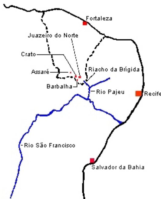
Karte: Der Cariri in Nordostbrasilien (eigene Darstellung)